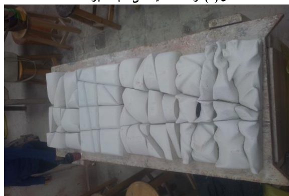
شكل (٦) مرحلة تجميع القوالب الحجر بعد الانتهاء من التشكيل