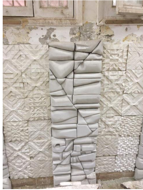
شكل (١٤) مرحلة الانتهاء من التركيب والنجميع للجدار اليمين من القاعة