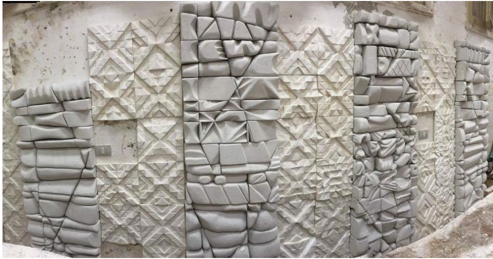
شكل (١٦) مرحلة الانتهاء من التركيب والنجميع للجدار اليسر من القاعة