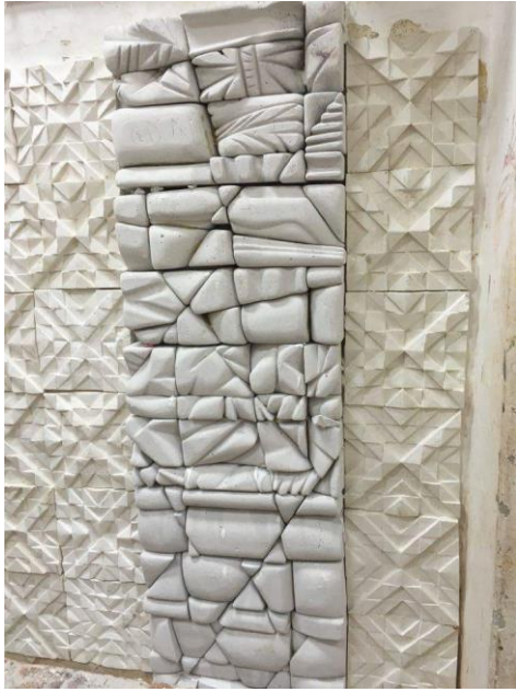
شكل (١٥) مرحلة الانتهاء من التركيب والنجميع للجدار الامامي من القاعة