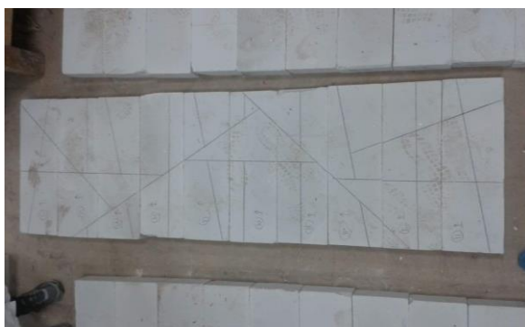
شكل (٥) مرحلة التخطيط على قالب الحجر الخفاف وترقيم القوالب