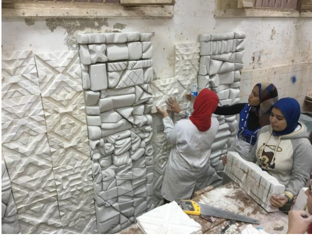
شكل (٩) تفصيلية مرحلة التجميع والتركيب للجدار