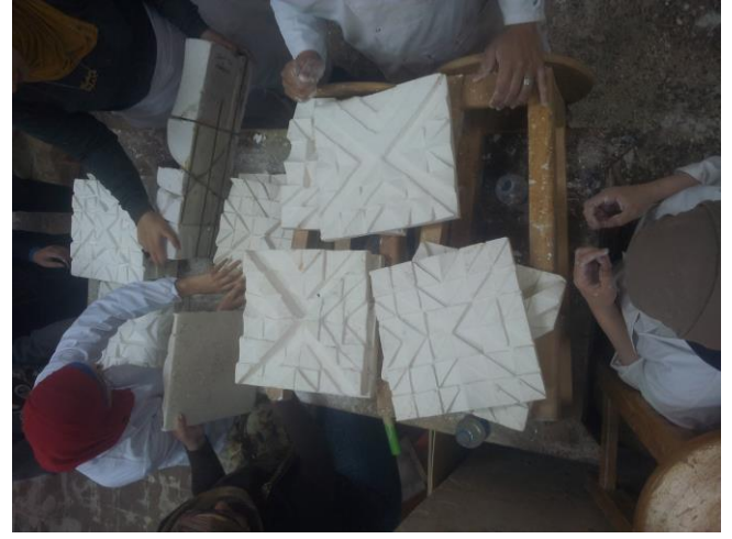
شكل (١٠) تفصيلية مرحلة التجميع للبلاطات الجبسية