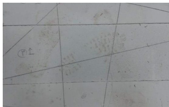
شكل (٤) مرحلة التخطيط على قالب الحجر الخفاف