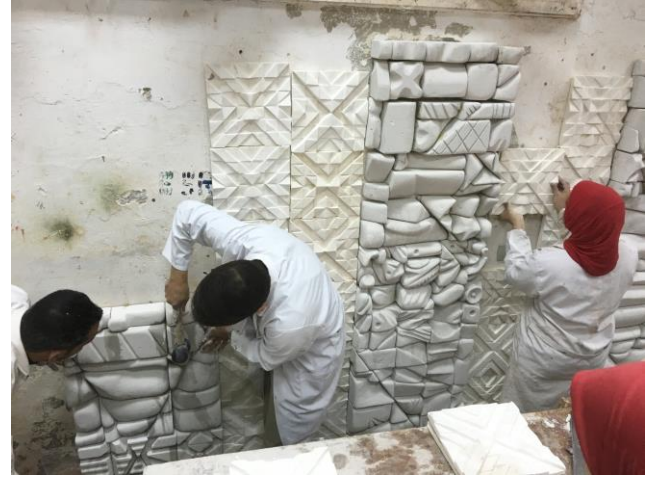
شكل (٨) تفصيلية مرحلة التجميع والتركيب للجدار