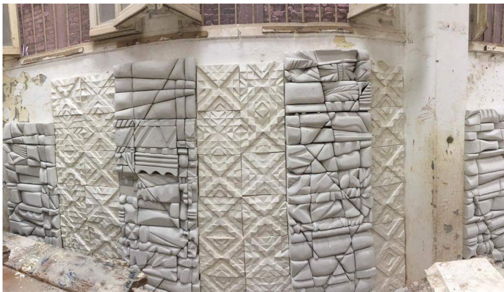
شكل (١٧) مرحلة الانتهاء من التركيب والنجميع للجدار اليسر من القاعة