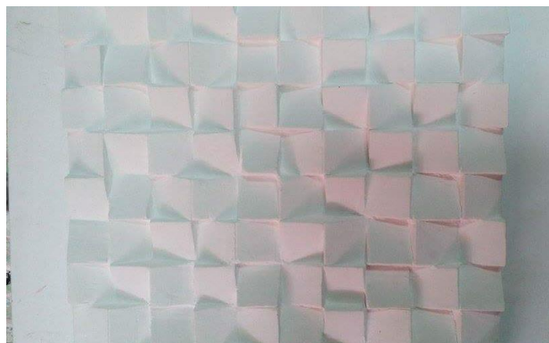
شكل (١) الشكل النهائي للبلاطة الجبسية