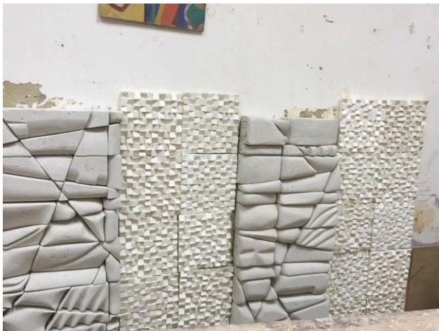
شكل (١٣) مرحلة الانتهاء من التركيب والنمى للجدار الامامى من القاعة