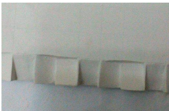
شكل (٣) مرحلة تنفيذ البلاطة الجبس