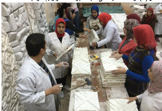
شكل (٧) تجميع وتركيب البلاطات الجبسية والقوالب الحجر على الحائط