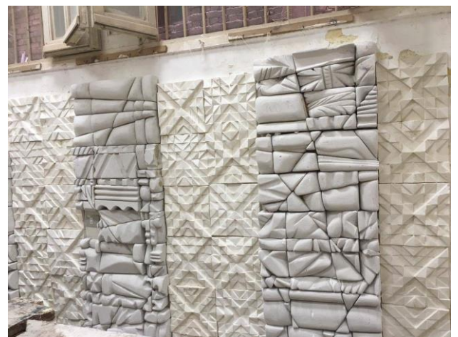
شكل (١٢) مرحلة الانتهاء من التركيب والنمى للجدار اليمين من القاعة