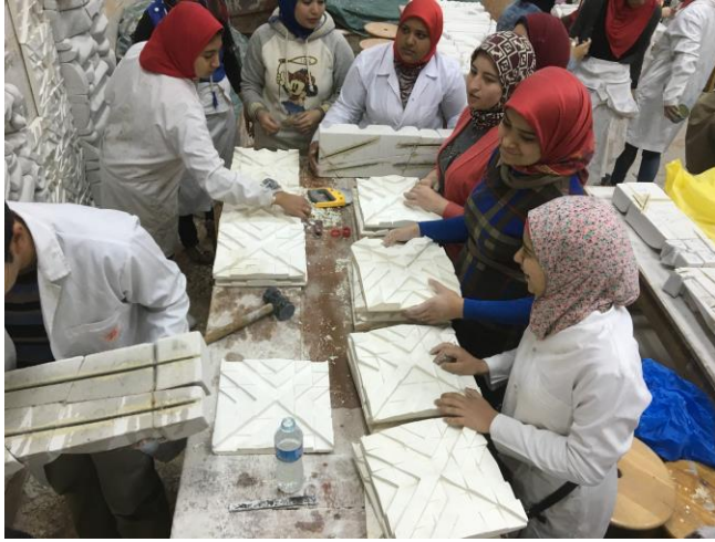
شكل (١١) مرحلة التجميع باستخدام الحديد المسلح فى التركيب